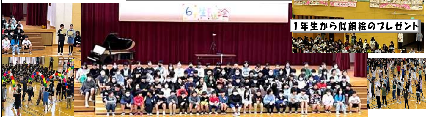
1年生から似顔絵のプレゼント