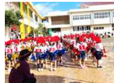
小学校最初の運動会(1年生)