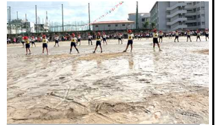
3年生ぬかるみにも負けず

第77回上田小学校運動会は、前日と早朝の雨で水浸しとなったグラウンドの整備からスタートしました。7時前には水のはき出しや砂入れを終了し、これで大丈夫と思った矢先にまた大雨が・・・。雨雲レーダーとにらめっこし「8時半頃には晴れてくる見通し」を信じ予定通り開催することを決定しました。保護者の皆様には、ご心配をおかけしました。ぬかるみもありましたが、予定通り3年生の演技からスタートすることができました。